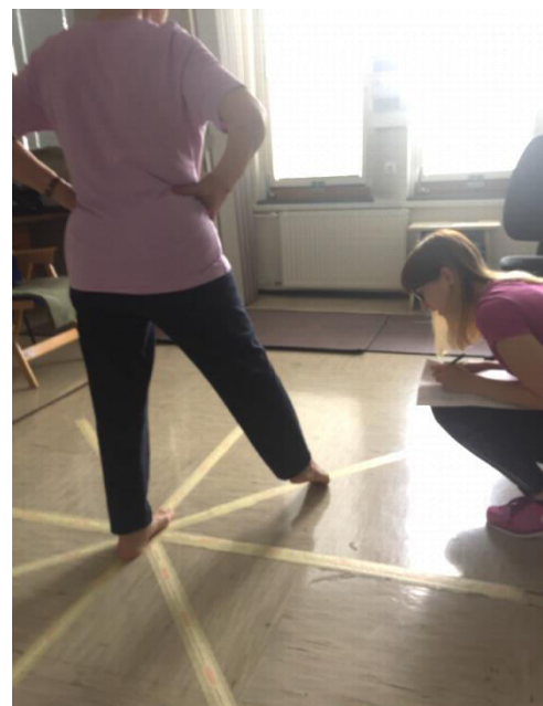
Slika 1: Postavitev lepilnih trakov za izvedbo testa in zapisovanje rezultatov med izvedbo anteromedialne smeri starejše preiskovanke

Postopek izvedbe testa je povzet po Gribble et al. (9). Osem lepilnih trakov smo prilepili na tla, ki se od sredine stičišča trakov razprostirajo navzven pod kotom 45^\circ . Zaradi lažjega odčitavanja doseženih razdalj smo pod lepilni trak postavili papirnat merilni trak (slika 1). Črte na tleh so poimenovane glede na smer gibanja v povezavi s stojno ного: anterolateralna (AL), anteriorna (A), anteromedialna (AM), medialna (M), posteromedialna (PM), posteriorna (P), posterolateralna (PL) in lateralna (L). Označba mreže trakov je različna za levo in desno ного (4),